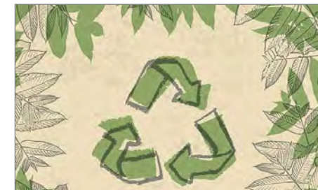
tegnet "look" på genbrugspap materiale