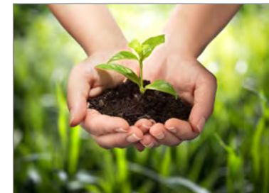
omtanke, miljøbevidst og nedbrydeligt materiale