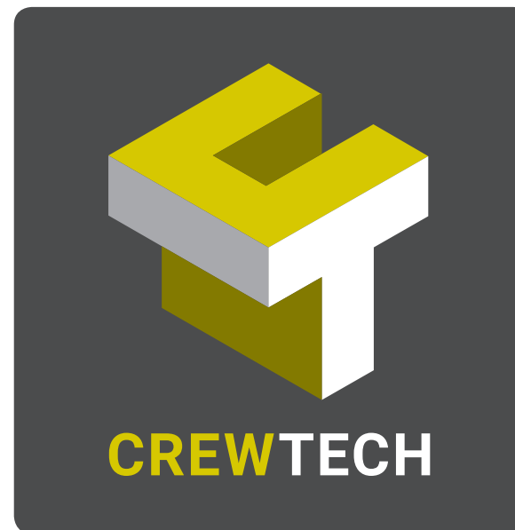
// NR. 1D - FIRKANTET (Negativ - f.eks. brysttryk og bagpå bilen)