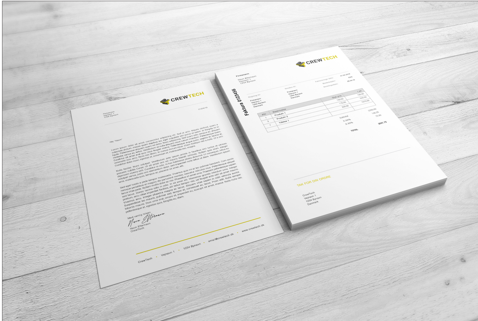
// Fiktiv FAKTURA og BREVPAPIR - for at vise et fiktivt visuelt udtryk