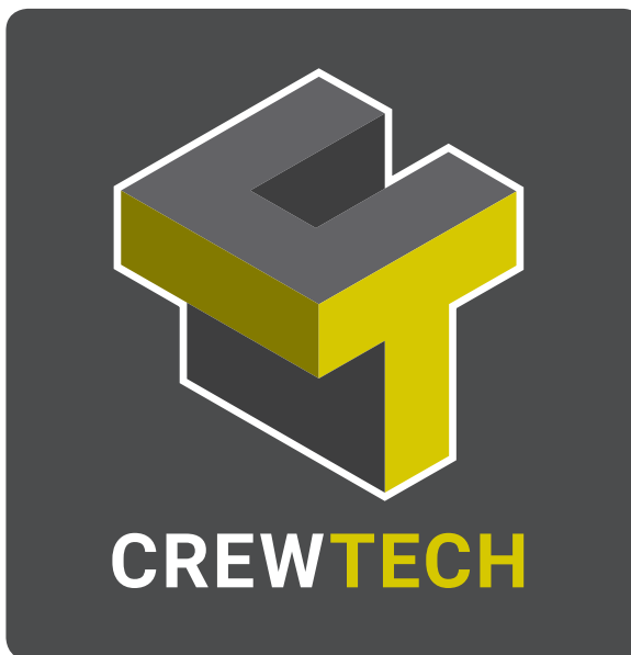
// NR. 1C - FIRKANTET (Negativ - f.eks. brysttryk og bagpå bilen)