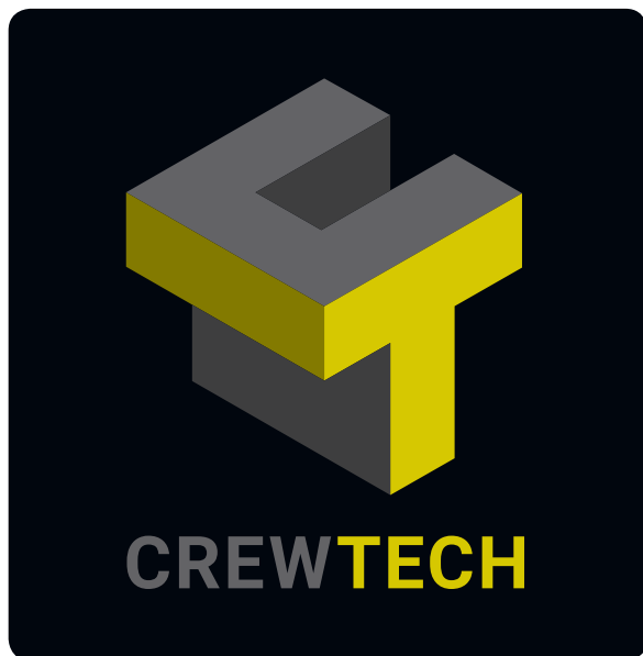
// NR. 1B - FIRKANTET (Negativ - f.eks. brysttryk og bagpå bilen)